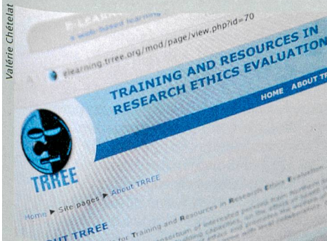
Ethik online: Auf TRREE sind rechtliche Bestimmungen für klinische Versuche einsehbar.

K linische Forschungsvorhaben – also Versuche mit Menschen – müssen, bevor sie beginnen, von einer Ethikkommission bewilligt werden. Die Kommission prüft unter anderem, ob die Privatsphäre der Versuchspersonen geschützt ist oder ob sie für allfällige Schäden, die sie im Verlauf des Versuchs eventuell erleiden, genügend versichert sind. Ethikkommissionen setzen sich in der Regel aus medizinischen, biostatistischen und juristischen Fachleuten, aber auch aus Laien zusammen. Für diese Personen (aber auch für alle anderen, die sich dafür interessieren) hat Dominique Sprumont vom Institut für Gesundheitsrecht der Universität Neuenburg mit Kolleginnen und Kollegen aus verschiedenen Ländern in Afrika das Online-Lernprogramm TRREE (Training and Resources in Research Ethics Evaluation) ins Netz gestellt, das grundlegende forschungsethische Überlegungen vermittelt. Auf elearning.tree.org sind zudem die spezifischen rechtlichen Bestimmungen für klinische Versuche in Deutschland und der Schweiz, aber etwa auch in Kamerun, Senegal oder Tansania auf Englisch, Deutsch, Französisch oder Portugiesisch einsehbar. Das weltweite Interesse ist rege: Bis Ende März haben über 5000 Personen mindestens ein Übungsmodul absolviert. Registriert sind mehr als 8000 Personen aus insgesamt 247 Ländern aller Kontinente. ori