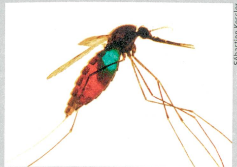
Nektar, Fruchtsäfte und Honigtau: Die Hauptnahrung der Stechmücke gelangt in einen Kropf (blau), das fremde Blut in den Magen (rot).

Laut der Studie bevorzugen die Mücken Saccharose und etwas weniger ausgeprägt Fructose und Glucose. Diese Zucker aktivierten die Geschmacksrezeptoren auf ihren Mundwerkzeugen. Bestimmte bittere Stoffe wie Chinin hemmen hingegen die Rezeptoren und den Appetit der Insekten. Bisher wurde der Kampf gegen Malaria mit Insektiziden geführt, aber die Stechmücken sind dagegen resistent geworden. Auf die Haut aufgetragene Repellentien – Vergrämungsmittel – wiederum sind teuer und verdunsten schnell. Der Forscher hofft, dass nun «weitere Substanzen geprüft werden können, die durch Kontakt wirken und den Mücken den Appetit verderben». Anne Burkhardt