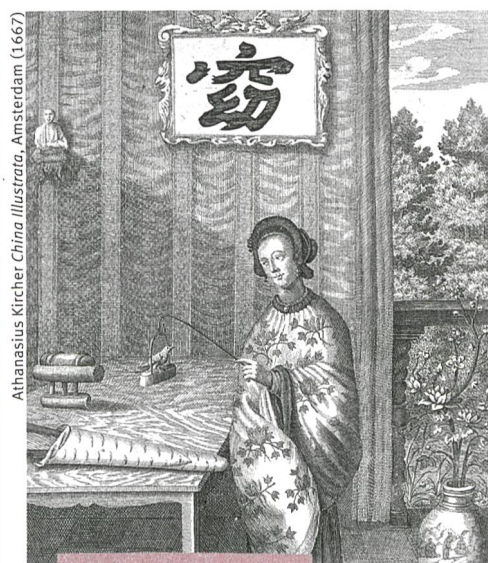
Kultur und Gesellschaft

38 Frauen, Konkubinen und Jesuiten Wie prägten jesuitische Missionare im China des 17. Jahrhunderts die Beziehungen zwischen Männern und Frauen?