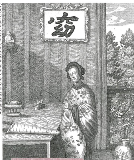
Kultur und Gesellschaft

38 Frauen, Konkubinen und Jesuiten Wie prägten jesuitische Missionare im China des 17. Jahrhunderts die Beziehungen zwischen Männern und Frauen?