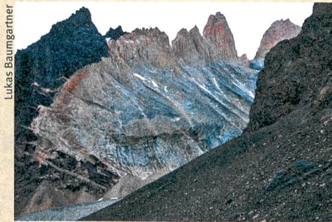
Im Fokus der Geologen: die Torres del Paine in Chile. Das vorgebundene Magma ist an der hellen Farbe erkennbar.