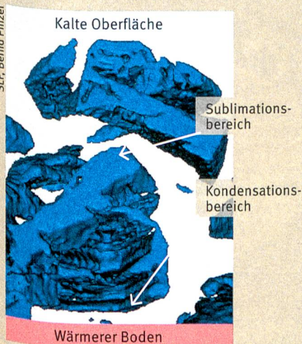
Kontinuierliche Veränderung: Dreidimensionale Sicht auf Schneekristalle.

Ein fundiertes Verständnis der Umwandlungsvorgänge in einer Schneedecke ist für ein effizientes Lawinenwarnsystem zentral. Die neu entstandenen Kristalle sind aufgrund ihrer Form nur lose miteinander verbunden. Sie formen deshalb schwache Schichten, auf denen sich gefährliche Schneebretter bilden können. pm