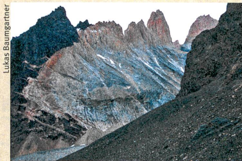
Im Fokus der Geologen: die Torres del Paine in Chile. Das vorgeprägte Magma ist an der hellen Farbe erkennbar.