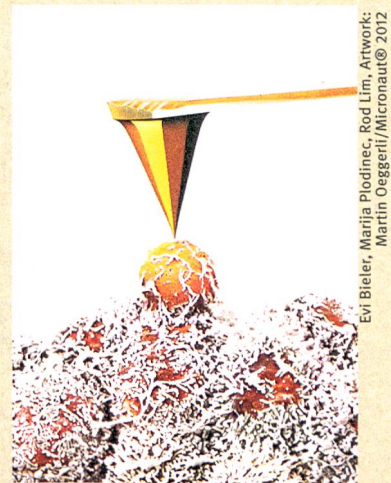
Neues Messverfahren: Die Spitze eines Atomkraftmikroskops misst die Eigenschaften einer Krebszelle.