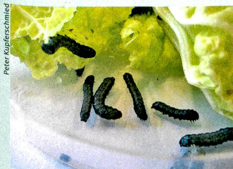
Biologischer Pflanzenschutz: Die Larven der Baumwolleule, eines Agrarschädlings, verzehren Blätter, die mit insektiziden Bakterien behandelt wurden.