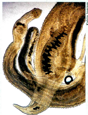
Parasiten in Aktion: Beim Pärchenegel liegt das Weibchen – nicht leicht erkennbar – teilweise im Männchen.