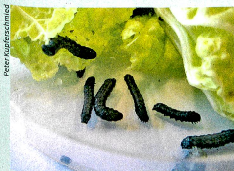
Biologischer Pflanzenschutz: Die Larven der Baumwollwurm, eines Agrarschädlings, verzehren Blätter, die mit insektiziden Bakterien behandelt wurden.