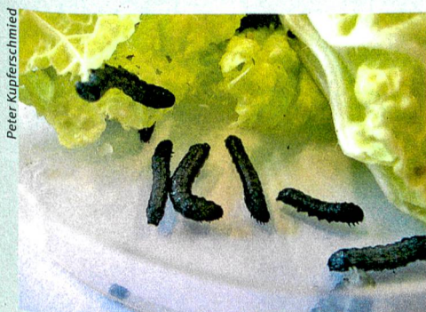
Biologischer Pflanzenschutz: Die Larven der Baumwolleule, eines Agrarschädlings, verzehren Blätter, die mit insektiziden Bakterien behandelt wurden.