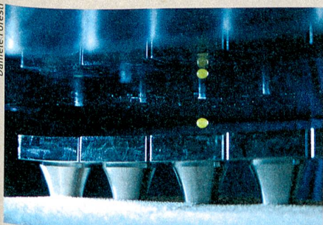
Kontaktlose Reaktionen: Die Akustophorese verstärkt die fluoreszierende Emission einer Chemikalie (grün).

D. Foresti, M. Nabavi, M. Klingauf et al. (2013): Acoustophoretic contactless transport and handling of matter in air. Proceedings of the National Academy of Sciences of the United States of America (doi:10.1073/pnas.1301860110/-/DCSupplemental).