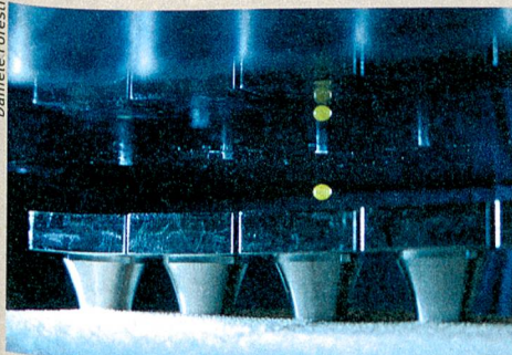
Kontaktlose Reaktionen: Die Akustophorese verstärkt die fluoreszierende Emission einer Chemikalie (grün).

D. Foresti, M. Nabavi, M. Klingauf et al. (2013): Acoustophoretic contactless transport and handling of matter in air. Proceedings of the National Academy of Sciences of the United States of America (doi:10.1073/pnas.1301860110/-/DCSupplemental).