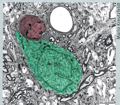
Ein Killer, der nicht immer tötet: Der Lymphozyt (rot) bedrängt das Neuron (grün).