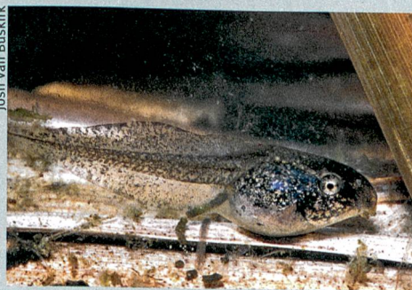
Keine simplen Reaktionsmaschinen: Kaulquappen können ihr Verhalten variieren.

Für seine Versuche hat Van Buskirk Kaulquappen in mit Laubböden bestückte Wassertanks gesteckt – und grosse Verhaltensunterschiede gefunden: Die Kaulquappen des Laubfroschs verbrachten viel weniger Zeit im Versteck unter dem Laub als die Kaulquappen des Seefroschs. Doch steckte Van Buskirk Käfige mit Libellenlarven in den Tank, die zwar keine Kaulquappen fressen konnten, diesen aber chemisch signalisierten, dass Feinde in der Nähe sind, suchten die Kaulquappen beider Arten weniger lang nach Nahrung. Aus seinen Resultaten schliesst Van Buskirk, dass sich die Kaulquappen zwar mit ihrem Verhalten an ihre Umgebung anpassen, dass sie aber ihr Verhalten variieren und also auf Fressfeinde reagieren können, denen sie in der Natur schon seit Jahrmillionen nicht mehr begegnet sind. ori