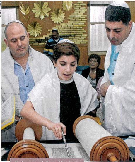
Kultur und Gesellschaft