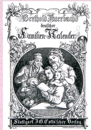
Gotthelf ebenbürtig: Das Werk Berthold Auerbachs.