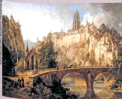
Romantisches Gegenbild zur Moderne: In seiner «Ansicht von Fribourg» (1826) blendet Domenico Quaglio den technischen Fortschritt, die Industrialisierung und die Massenarmut aus.

B. Roeck, M. Stercken, F. Walter, M. Jorio, T. Manetsch (Hg.): Schweizer Städtebilder. Urbane Ikonographien (15.–20. Jahrhundert) – Portraits de villes suisses. Iconographie urbaine (XVe–XXe siècle) – Vedute delle città svizzere. L'iconografia urbana (XV–XX secolo). Chronos, Zürich 2013, 640 S., 400 farbige Abb.