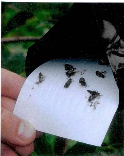
In der Falle: Apfelwickler im Flugstadium sind dem Pheromon auf den Leim gekrochen.