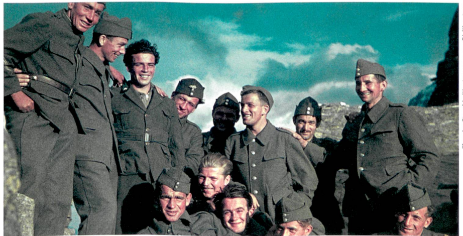
Unter Männern: Schweizer Soldaten kurz nach Kriegsausbruch an der italienischen Grenze, 1940.