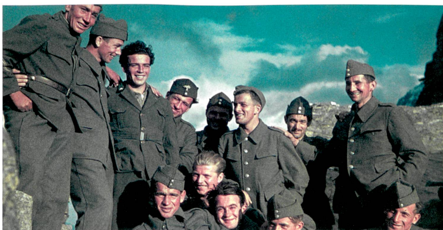
Unter Männern: Schweizer Soldaten kurz nach Kriegsausbruch an der italienischen Grenze, 1940.