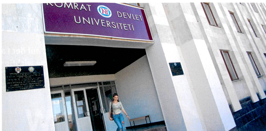
Keine Rückkehr: Viele moldawische Forschende wandern aus, würden aber gern in ihre Heimat zurückkehren (Staatliche Universität Comrat, 2007).

Resultate zeigen, dass die meisten noch immer regelmässigen Kontakt mit der Heimat pflegen. Über 40 Prozent schicken Verwandten Geld, damit diese finanziell über die Runden kommen. Viele der ausgewanderten Forschenden haben auch schon mit Kollegen in Moldawien gemeinsame Projekte durchgeführt oder an Tagungen in der Heimat teilgenommen. Vielen fehlt aber schlicht die Zeit, um mehr für die Entwicklung der Wissenschaft in ihrem Heimatland zu tun. Und viele sind der Ansicht, dass die Regierung mehr für die Forschung unternehmen sollte. Eine Mehrheit würde gerne wieder nach Moldawien zurückkehren – angesichts der prekären finanziellen Lage und der schlechten Infrastruktur im Land glauben allerdings die wenigsten an akzeptable Berufsaussichten. Simon Koechlin