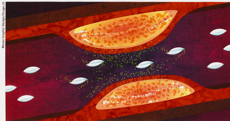
Intelligente Nanocontainer: An der verengten Stelle einer Arterie setzen sie den Wirkstoff frei (Illustration).

Kiefer mit Forscher in Lappland: Bohrproben liefern Anhaltspunkte für die Klimaentwicklung.