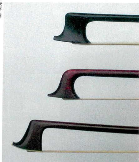
Erzeugen unterschiedliche Klänge: Drei Geigenbögen aus der ersten Hälfte des 19. Jahrhunderts.