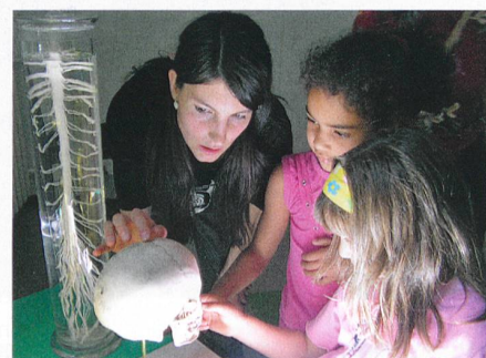
Science et Cité

Der SNF erfasst neu den Output der von ihm unterstützten Forschung. Dazu gehören unter anderem Publikationen der Forschenden, wissenschaftliche Veranstaltungen und Kommunikationsaktivitäten. Mit dieser Initiative kommt der SNF Forderungen des neuen Forschungs- und Innovationsgesetzes nach, den Output der von ihm geförderten Projekte für Öffentlichkeit und Politik besser sichtbar zu machen. Der SNF wird die Output-Daten via Projektdatenbank ab 2012 öffentlich zugänglich machen und später zu quantitativen Darstellungen verarbeiten. Der SNF ist sich jedoch bewusst, dass es schwierig ist, den von ihm finanzierten Output genau zu identifizieren und zu quantifizieren. Deshalb wird er die Daten mit der nötigen Vorsicht auswerten. Erste Ergebnisse sind in zwei bis drei Jahren zu erwarten, wenn ausreichendes Datenmaterial vorliegt.