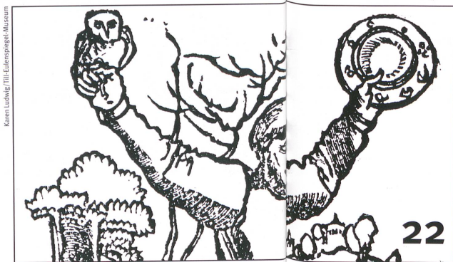
Karen Ludwig/Till Eulenspiegel-Museum