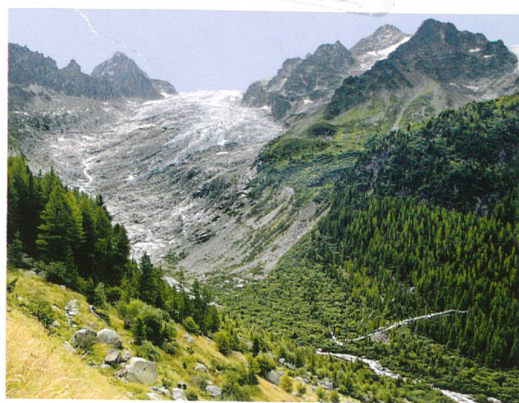
Das Klima am Werk: Der Glacier du Trient 1891 (oben) und heute (unten). Bilder: Oscar Nicollier «Glacier du Trient», 1891 / Médiathèque Valais, Martigny; Hilaire Dumoulin, 2009