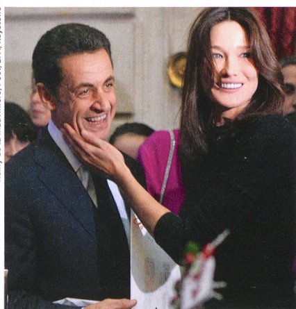
Narzissmus inklusive: Nicolas Sarkozy, Carla Bruni-Sarkozy (2009).