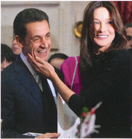
Narzissmus inklusive: Nicolas Sarkozy, Carla Bruni-Sarkozy (2009).