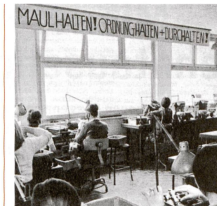
Alles eine Frage der Haltung: Mädchenerziehungsanstalt Lärchenheim, Appenzell Ausserrhodan (1970).