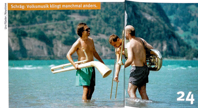
Schräg: Volksmusik klingt manchmal anders.