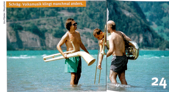
Schräg: Volksmusik klingt manchmal anders.