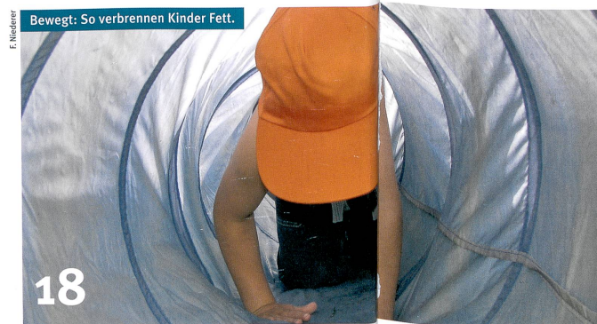
Bewegt: So verbrennen Kinder Fett.

6 Die Hieroglyphen der Maya lassen sich mit Computerhilfe besser entziffern.