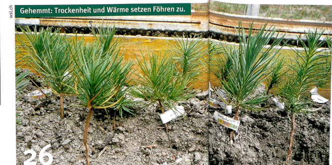
Gehemmt: Trockenheit und Wärme setzen Föhren zu.