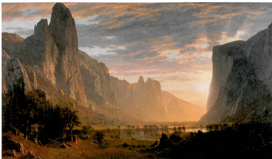
Bewahrung um seiner Schönheit willen: Das kalifornische Yosemite-Tal (Albert Bierstadt: «Looking Down Yosemite Valley», 1865).