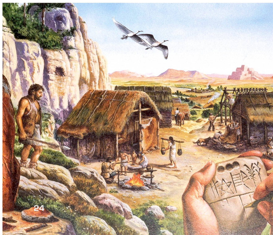
Christian Jégou / Pö / SPL / Keystone

«Rousseau zum Beispiel sagte zwar deutlich, dass er nicht Geschichte betreibe, war aber auf die konkrete Vorstellung einer Urzeit angewiesen, um seinen abstrakten Ur-Typus des Menschen denken zu können», sagt Patricia Purtschert. Die Philosophie griff auf die wachsende Zahl von Reisebeschreibungen zurück, die ein plastisches Bild jener ausser-europäischen Menschen lieferten, die dem ursprünglichen Menschen vermeintlich noch ganz nahe waren. «Das moderne Ursprungsdenken ist eng verknüpft mit einer kolonialen, eurozentrischen Ordnung der Kulturen, die bis heute nachwirkt.» Der gute Urmensch, der uns sagt, was die Männer und Frauen im Grund unterscheidet, hat also einen bösen Zwillingbruder: den primitiven, unzivilisierten Fremden. Je nach Konjunktur rückt einmal der eine oder andere stärker ins Rampenlicht. ■