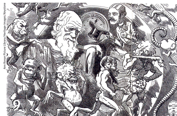
Umstrittener Kopf: Darwin in einer frühen Karikatur (1882)