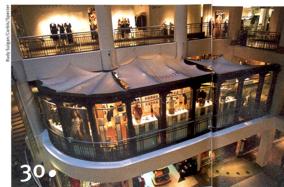
Aus den Tiefen: mehr Platz fürs Leben an der Erdoberfläche

«So unerfreulich diese Krise ist – aus der Sicht des Wissenschaftlers ist sie ein interessantes Objekt.»