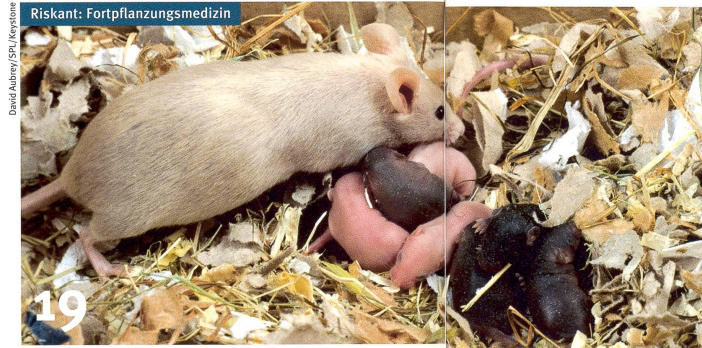
19 Riskant: Fortpflanzungsmedizin