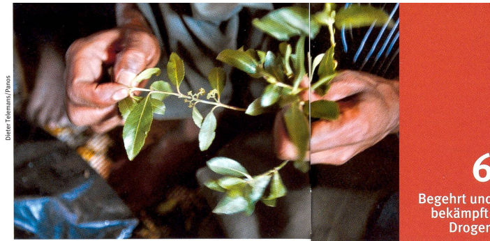
6 Begehrt und bekämpft: Drogen