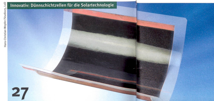
27 Innovativ: Dünnschichtzellen für die Solartechnologie