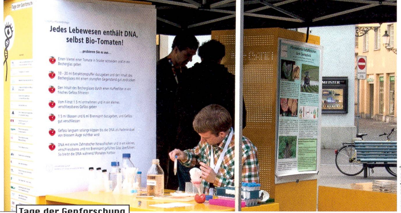
Tage der Genforschung

Frage und Antwort stammen von der SNF-Website www.gene-abc.ch , die unterhaltsam über Genetik und Gentechnik informiert.