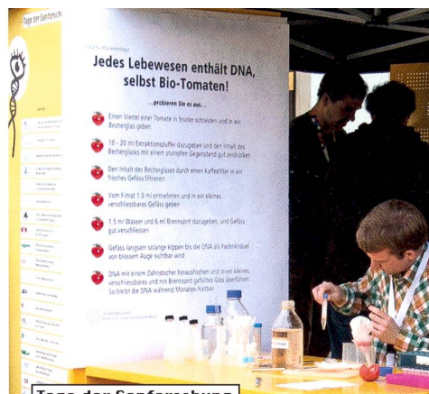
Tage der Genforschung