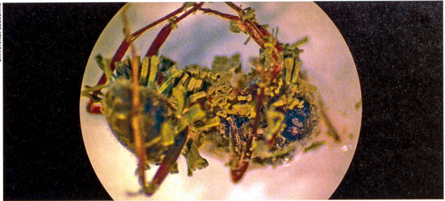
Der Parasit war stärker: Tote Ameise, vom Pilz Metarhizium anisopliae (grün) befallen.