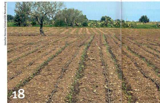
Tropfen für Tropfen kostbar: Grundwasser ist ein weltweit knappes Gut.