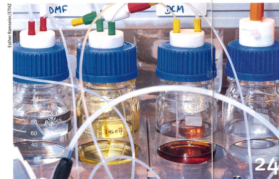
Impfung gegen Malaria: Eine Zuckermaschine bereitet den Weg.