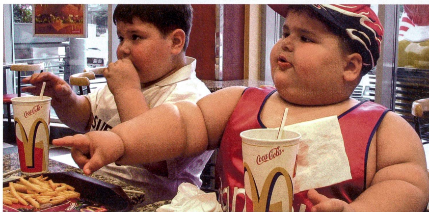
Schlemmen in der Schnellimbisskette: Zu oft ist oft zu viel.

Nature Immunology, Band 9, Seiten 424–431