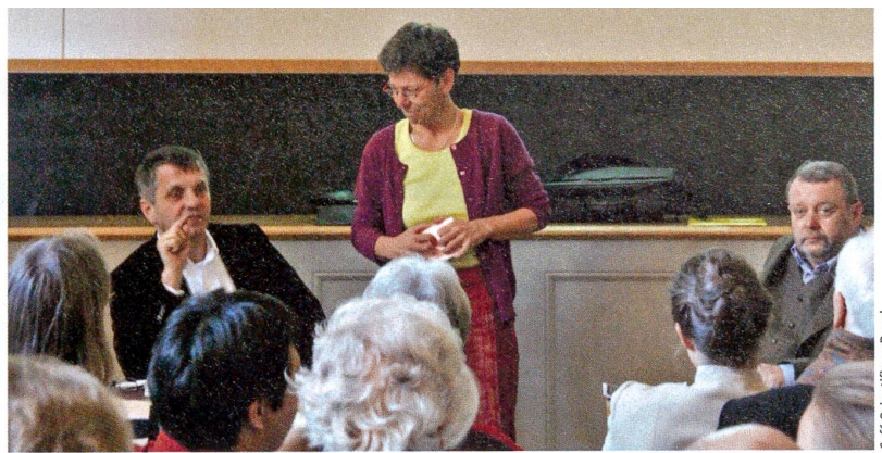
Café Scientifique Basel

Frage und Antwort stammen von der SNF-Website www.gene-abc.ch , die unterhaltsam über Genetik und Gentechnik informiert.