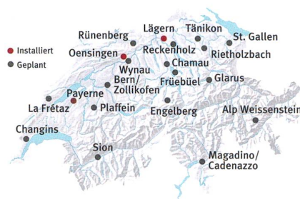
Standorte der Swisssmex-Messtellen Grafik: Swisstopo/Studio25, LoD

Vorläufig sind diese Erkenntnisse noch theoretischer Natur. Doch konnten sie kürzlich in «Nature» publiziert werden. «In den letzten Jahren hat die Wissen-