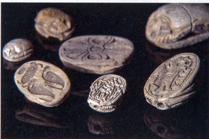
Antike Skarabäen aus der Sammlung des Bibelforschers Othmar Keel

wichtigsten Themen, mit denen sich die Spitzenforschung zu Beginn des 21. Jahrhunderts befasst. Die Auswahl will nicht repräsentativ sein, vielmehr stellt sie Forschende vor, die mit ihrer