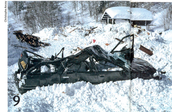
Wäre sie zu vermeiden gewesen? Todbringende Lawine