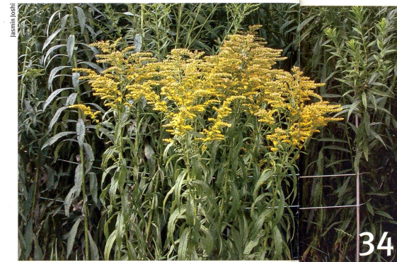
Ganz schön aggressiv: invasive Pflanzen