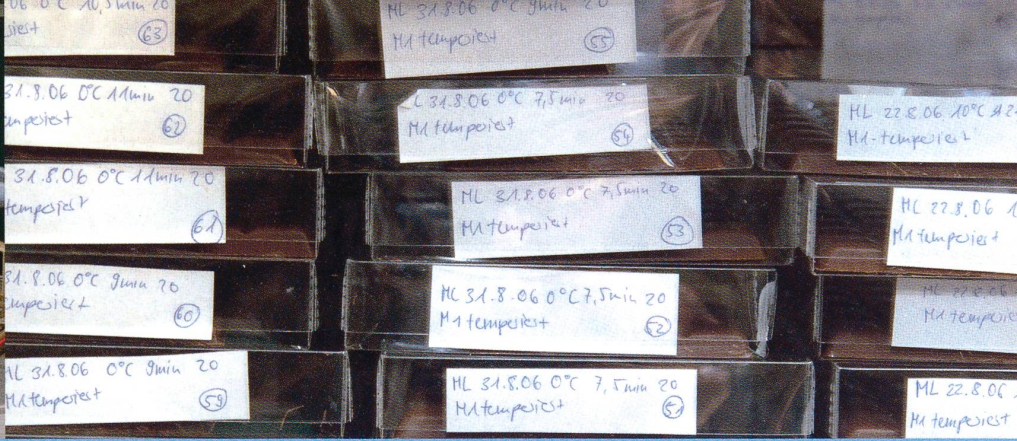
Schokoladenkreation im Labor: Im Vorkristallisator (unten links) lassen sich die Eigenschaften der braunen Masse festlegen, später wird sie zu Tafeln gegossen und bei 18 Grad gelagert (oben).