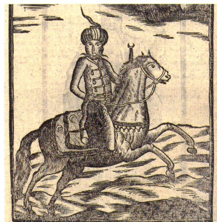
Gefahr aus dem Osten: türkischer Krieger aus dem Appenzeller Volkskalender, 1771

Angewandte Chemie, International Edition (2007), Band 46, Seiten 4089 – 4092