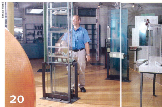
Die Wissenschaft wird kommunikativ.