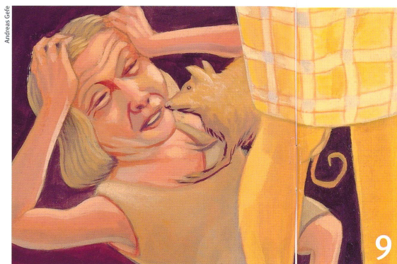
Wenn Ängste überhand nehmen.