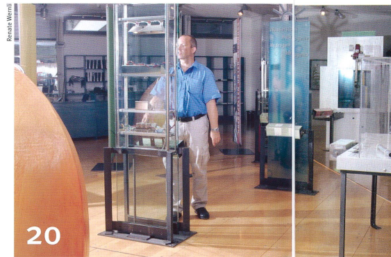
Die Wissenschaft wird kommunikativ.