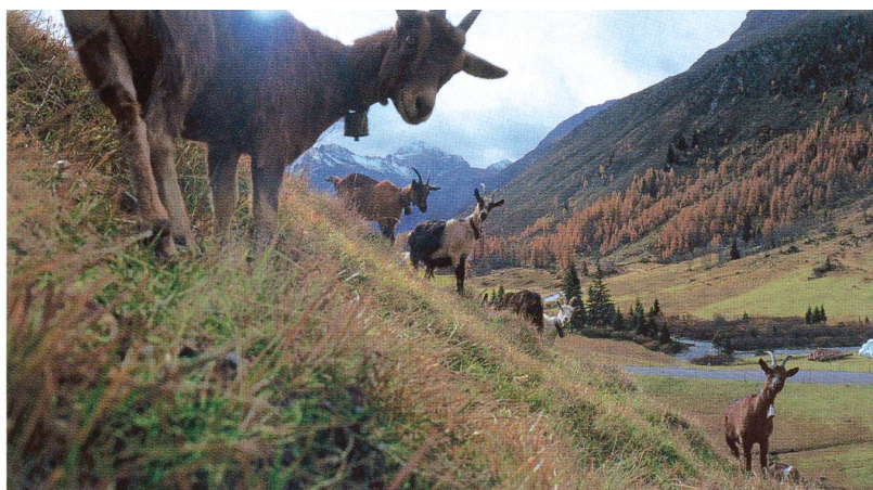
swiss-image.ch (t), VHS Basel

Quelle: Frage und Antwort stammen von der SNF-Website www.gene-abc.ch , die unterhaltsam über Genetik und Gentechnik informiert.