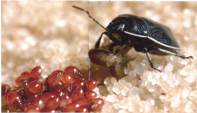
Weibliche Erdwanze bringt einen Samen der Purpuraubnessel zu ihren Larven.