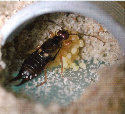
Ohrwurmweibchen hütet sein Gelege im Labornest.