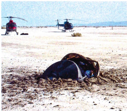
Die Überreste der Genesis-Kapsel nach dem Absturz im Jahr 2004 in der Wüste von Utah.