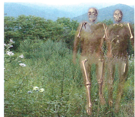
Virtuelle Rekonstruktion von zwei Skeletten in der Landschaft von Dmanisi: links eine erwachsene, rechts eine jugendliche Person

Science (2007), Band 317, Seiten 111–114