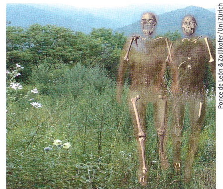
Ponce de León & Zollikofer/ Uni Zürich

Science (2007), Band 317, Seiten 111–114