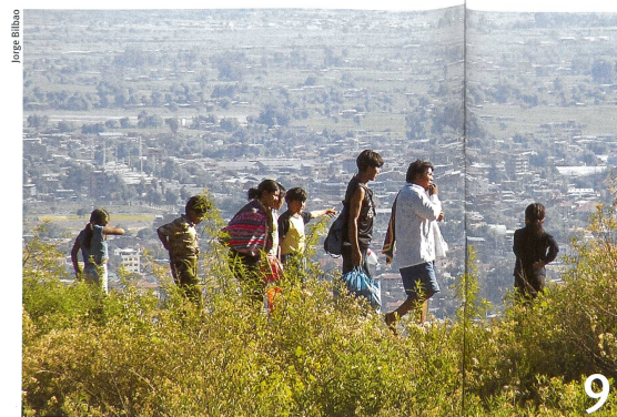
Landschafts-Schutzgebiete müssen viele Bedürfnisse erfüllen.