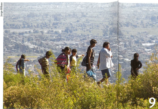
Landschafts-Schutzgebiete müssen viele Bedürfnisse erfüllen.