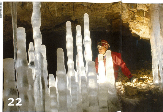
Auf Eishöhlen hat der Sommer kaum einen Einfluss.