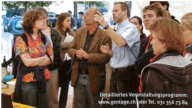
Detailliertes Veranstaltungsprogramm: www.gentage.ch oder Tel. 031 356 73 84

«Horizonte», Schweiz. Nationalfonds Wildhainweg 20, 3001 Bern Fax 031 308 22 65, E-Mail: pri@snf.ch