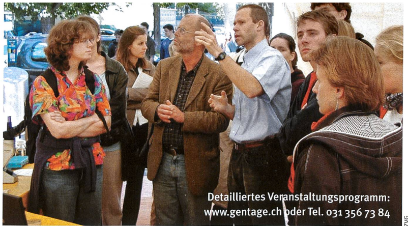
Detailliertes Veranstaltungsprogramm: www.gentage.ch oder Tel. 031 356 73 84

«Horizonte», Schweiz. Nationalfonds Wildhainweg 20, 3001 Bern Fax 031 308 22 65, E-Mail: pri@snf.ch