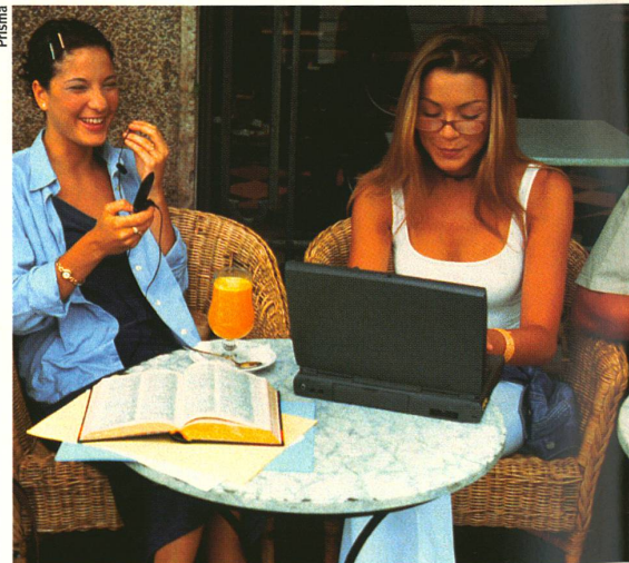
Mobiltelefone und Laptops könnten mobile Antennen bilden.