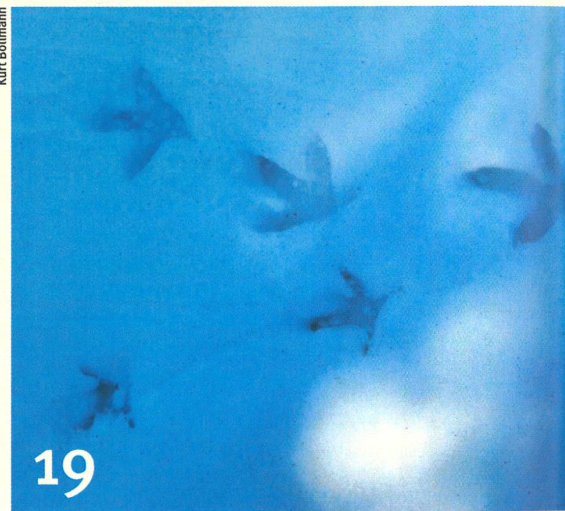
In der Schweiz selten geworden: Auerhuhnsuren im Schnee