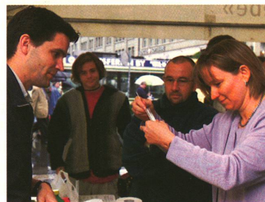
Selber DNA isolieren, mit Forschenden diskutieren: Die «Tage der Genforschung» machen es möglich.