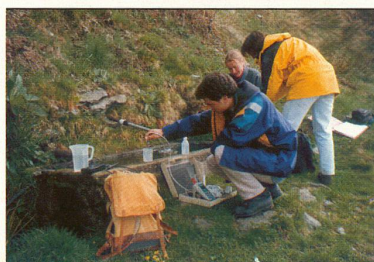
UNTERSCHÄTZT: An manchen Orten hat es zu viel Arsen im Trinkwasser, auch in der Schweiz – ein Gesundheitsrisiko?