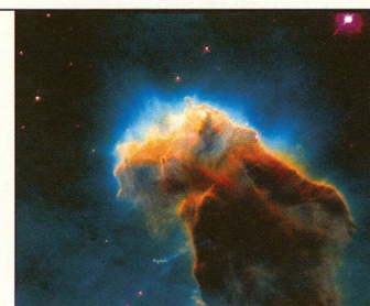
NACHRICHT AUS DEM ALL: Früher hatten die Sterne göttliche Bedeutung, heute entlockt ihnen die Forschung Informationen über die Entstehung des Universums.