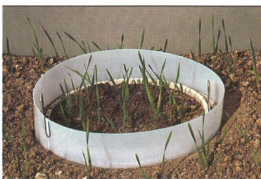
GENTECH-WEIZEN: Welche Auswirkungen hat der brandpilzresistente Weizen der ETH Zürich auf Insekten und Bodenlebewesen? Schweizer Biosicherheitsforscher versuchen, die Risiken abzuschätzen.