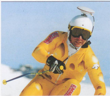
GPS IM SCHNEE: Satelliten schlüpfen in die Rolle des Trainers. Sie informieren den Skirennfahrer, wo auf der Piste er wertvolle Sekunden gewonnen oder verloren hat.